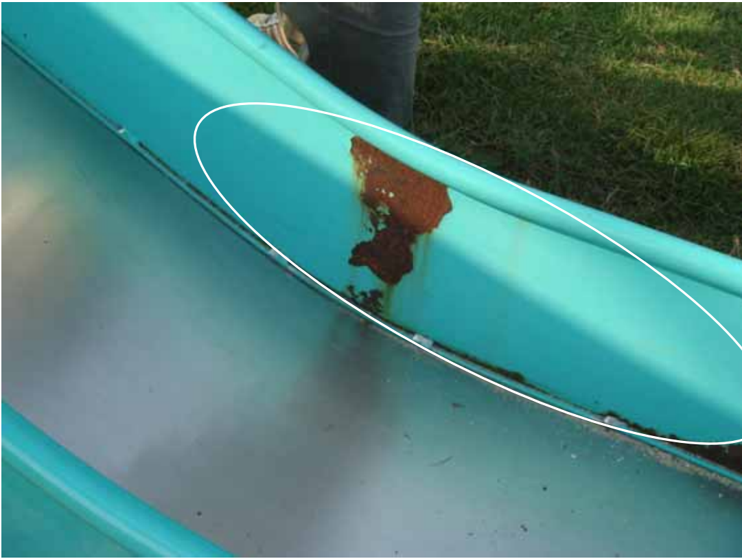
写真 5 塗装