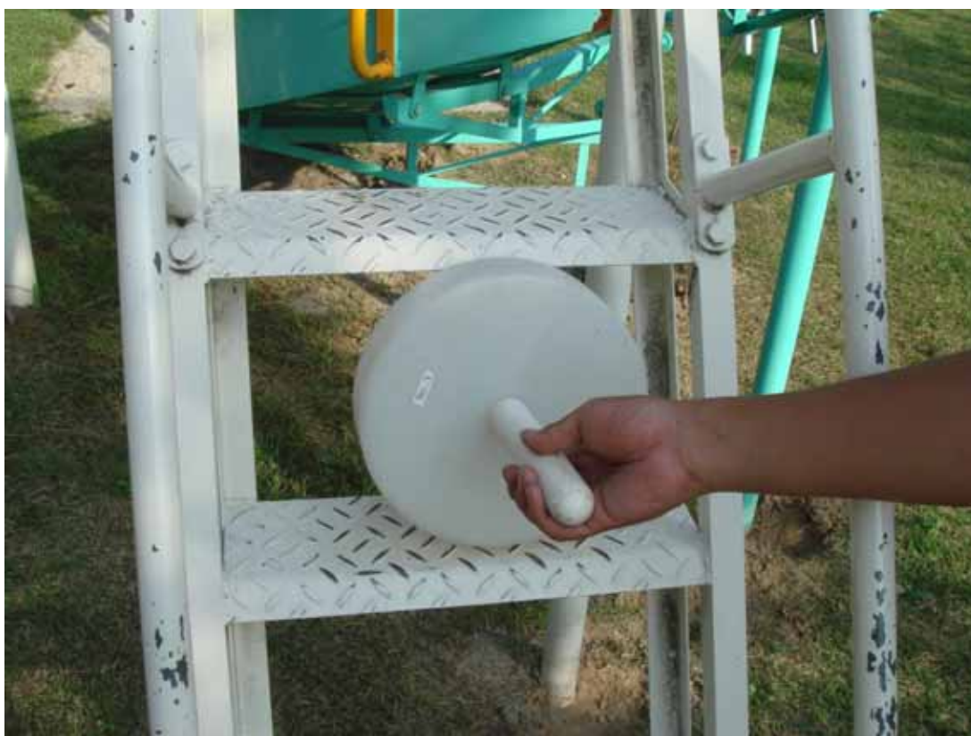
写真4 危険な角度で隙間のある梯子を安全な物に交換する。(同色の新品に交換)