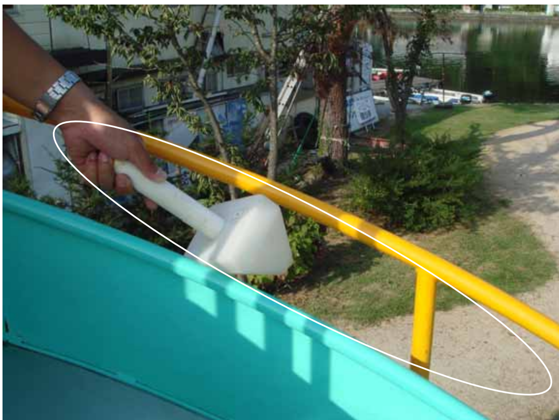
写真3 危険な隙間を無くす。(検査器具が通過しないようにする。100mm以下)