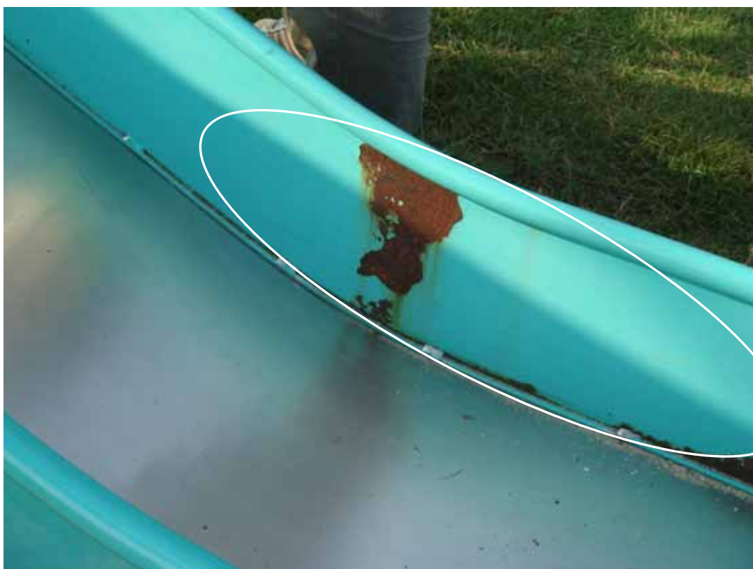
写真 5 塗装